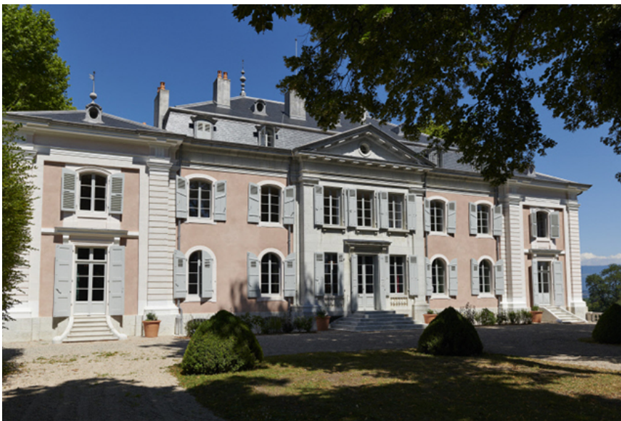
Le Château de Voltaire

Le Collectif Confrontations, à l'origine du festival des Confrontations Photo , s'est associé au Centre des monuments nationaux afin de créer un nouveau prix photographique : le Prix Voltaire de la Photographie . Celui-ci se destine à soutenir et promouvoir "une approche contemporaine et originale du portrait photographique", thème exclusif choisi par les organisateurs. Doté financièrement, il permettra également au lauréat de voir son travail exposé dans les salles de monuments prestigieux de notre patrimoine culturel à partir d'octobre 2020.